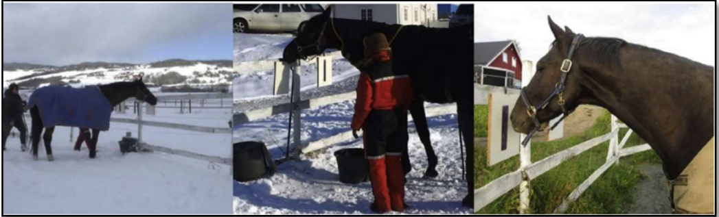
Figura 2 – Experimento com cavalos