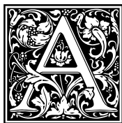
figura da deficiência como algo diferente do tido como “normal” sempre foi tratado com teor pejorativo, as vezes relacionado com forças malignas, cuja “imperfeição” acarretava a morte do recém-nascido, na idade antiga.

Por muito tempo a deficiência fora vista, exclusivamente, pela perspectiva médica, de forma isolada, associada a alguma patologia. Em suma, ser deficiente era ser uma pessoa doente.