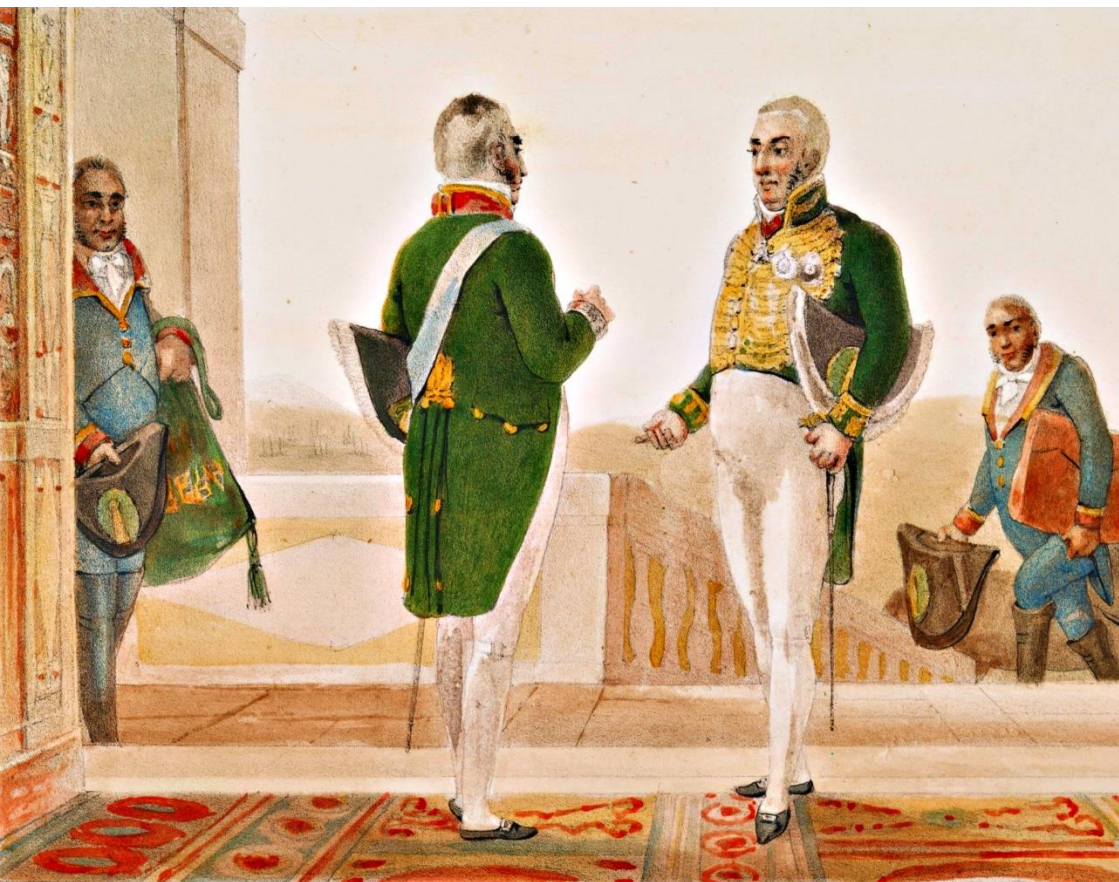
COSTUME DES MINISTRES .

Revista Jurídica Luso-Brasileira Ano 2 (2016), nº 3