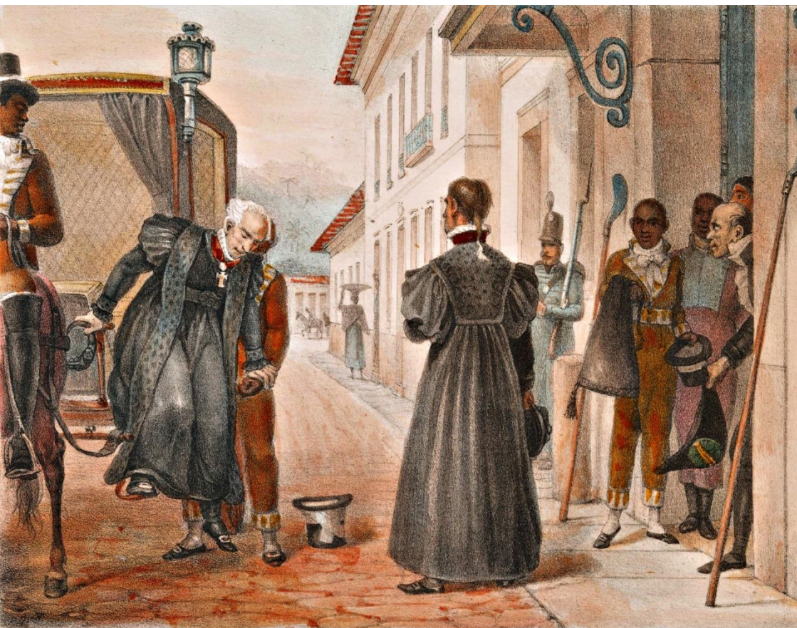
DESEMBARGADORES , arrivant en Costume au Palais de Justice.