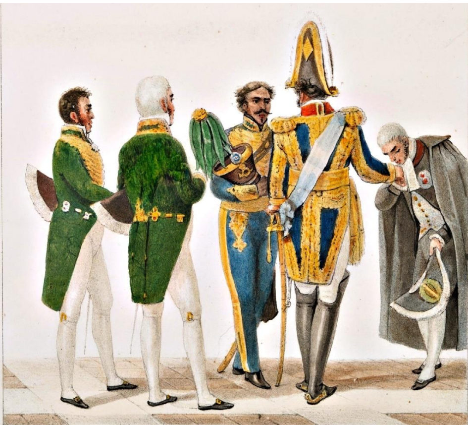
L'EMPEREUR SUIVI D'UN CHAMBELLAN ET D'UN PREMIER VALET DE CHAMBRE.

Revista Jurídica Luso-Brasileira Ano 2 (2016), nº 4